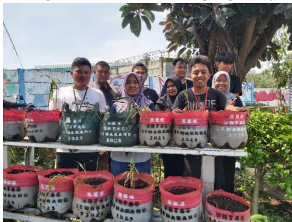
Figure 4. Penanaman Jahe Merah

Hasil ini menunjukkan bahwa pendekatan berbasis partisipasi masyarakat dalam ketahanan pangan dapat meningkatkan keberlanjutan program (Rahman et al., 2021).