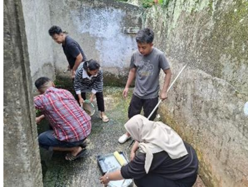
Figure 1. Renovasi Sendang

Penelitian sebelumnya menunjukkan bahwa peningkatan akses terhadap sumber daya air dapat meningkatkan kualitas hidup masyarakat serta mendukung ketahanan pangan dan lingkungan (Miles et al., 2014).