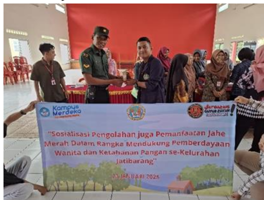
Figure 2. Edukasi dan Pelatihan Pengolahan Jahe Merah

Temuan ini menunjukkan bahwa pelatihan berbasis komoditas lokal dapat menjadi strategi efektif dalam meningkatkan kesejahteraan ekonomi masyarakat (Sari & Lestari, 2023). Selain itu, jahe merah juga memiliki potensi ekspor yang dapat mendukung industri herbal nasional (FAO, 2021).