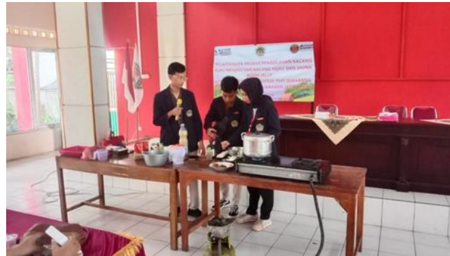
Figure 1. Edukasi dan Pelatihan Pengolahan Kacang Hijau