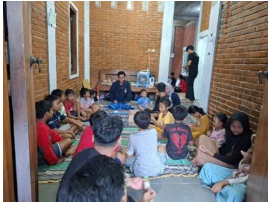
Figure 3. Edukasi Gizi

Temuan ini sejalan dengan laporan Kementerian Kesehatan RI (2022) yang menyoroti pentingnya edukasi gizi dalam menekan angka malnutrisi dan meningkatkan kesadaran masyarakat akan pentingnya pola makan sehat.